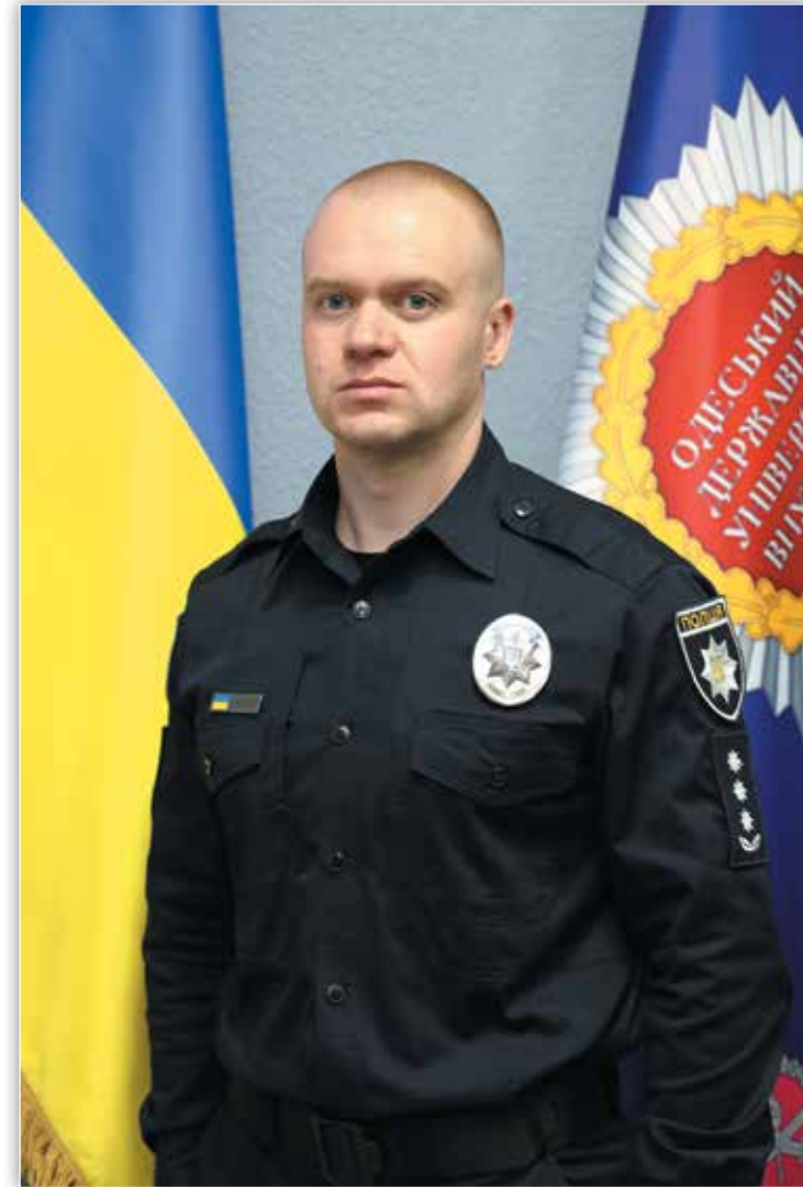
Ректор Одеського державного університету внутрішніх справ полковник поліції В'ячеслав ДАВИДЕНКО

Сьогодні університет ставить перед собою нові цілі і досягає їх, роблячи свій вклад в Перемогу. Діяльність університету була б неможливою без військовослужбовців Збройних сил України, добровольців та всіх тих людей, які захищають нашу державу та виборюють її незалежність! Слава Україні! Героям слава!